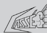
Coalition de l'Association pour une Solidarité Syndicale Étudiante Élargie